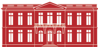
château de Bouges